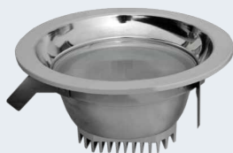
ДВО 12 «Сатурн 2»