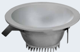
ДВО 12 «Сатурн 1»